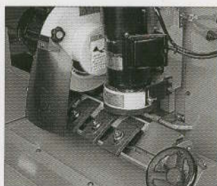
④センサー付ヘッド

※GXタイプは、全てのモデルに、ハイス用ベシ、ハイス用マグネット、超硬兼用ベシ、超硬兼用マグネットの設定があります。