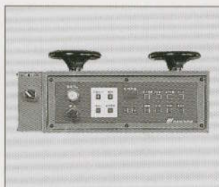
③全面集中制御方式 (マイコン内蔵)